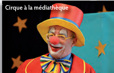
Cirque à la médiathèque