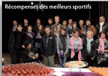
Récompenses des meilleurs sportifs