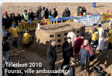
Téléthon 2010 Fouras, ville ambassadrice