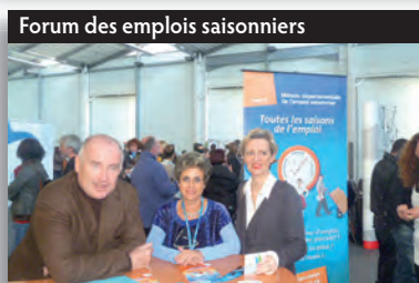
Forum des emplois saisonniers

La Lettre du Maire est une publication de la Mairie de Fouras : Place Lenoir - BP 69 - 17450 Fouras Directeur de publication : Sylvie Marcilly Rédaction : Commission Communication