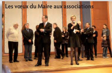
Les vœux du Maire aux associations