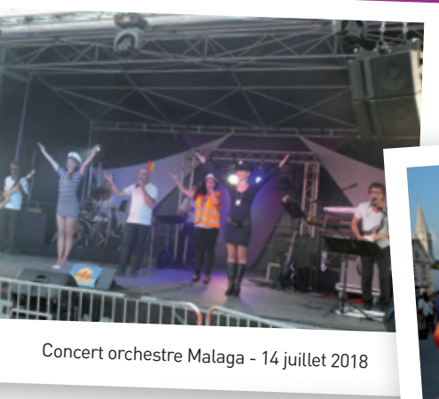
Concert orchestre Malaga - 14 juillet 2018