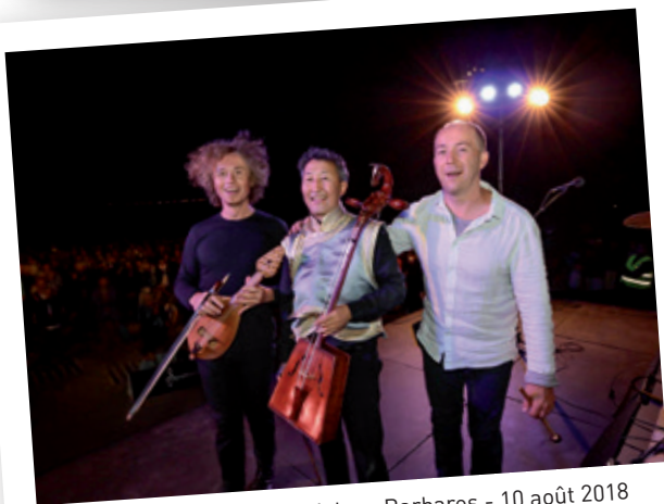
Symphonie d'été, Les Violons Barbares - 10 août 2018