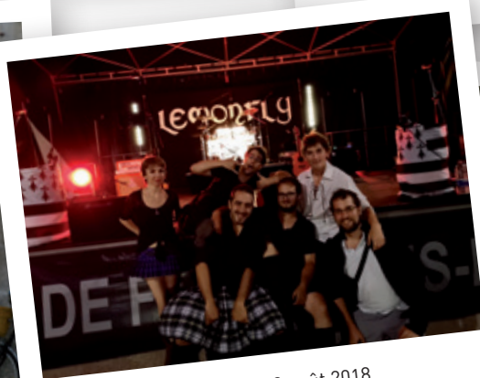
Lemonfly - 23 août 2018