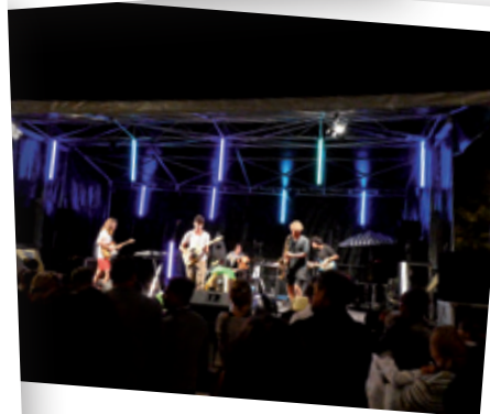
Le Biscuit - 30 août 2018