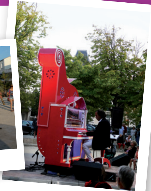
Frédéric La Verde et le piano rouge - 26 juillet 2018