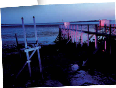
Carrelets en Lumière - 20 et 21 août 2018