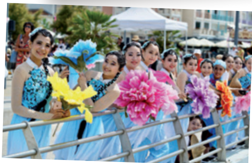
Fei Yang Folk Dance Group de Tainan - Festival de Confolens - 12 août 2018