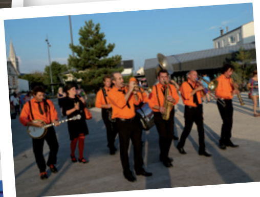
Fanfare le SNOB - 15 juillet 2018