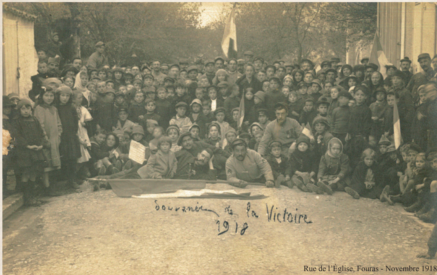
Rue de l'Église, Fouras - Novembre 1918