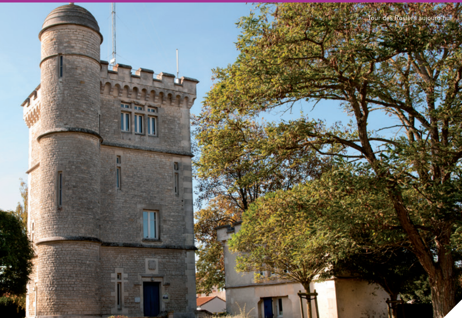
Tour des Rosiers aujourd'hui