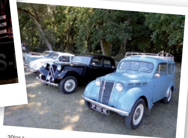
30 ème bourse auto-moto du CLAM'S - 1 er et 2 septembre 2018