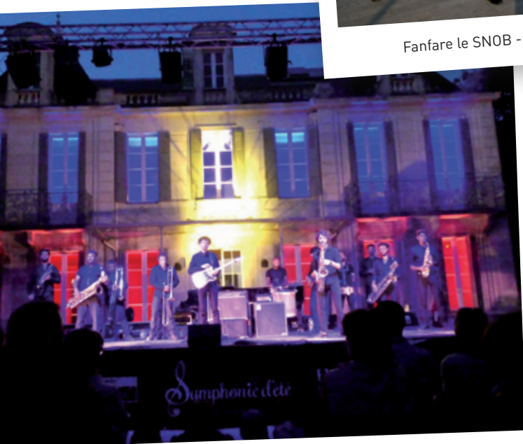
Symphonie d'été, Labulkrack - 9 août 2018