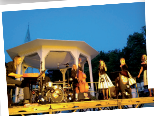
Concert Sugar Hearts - 16 août 2018